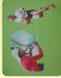
Sporto ir menų šventės